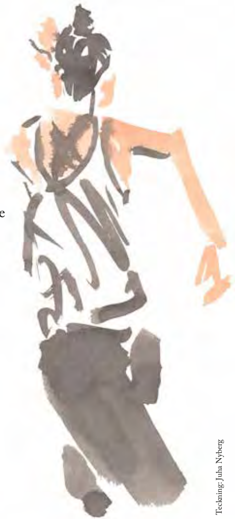
Teckning: Jutta Nyberg